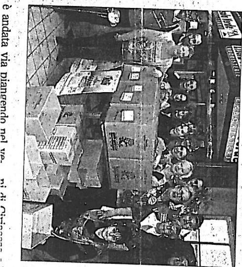
A destra, gli Alpini della sezione locale, che hanno effettuato la colletta alimentare all'ipermercato Bennet. A lato, i volontari che hanno partecipato alla raccolta presso l'ipercoop di Via Robassomero