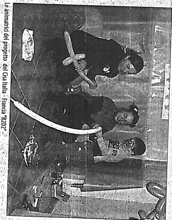
L'animatrice del progetto del Cisa Italia - Francia "R2D2"